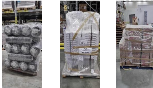
*. התמונות להמחשה בלבד